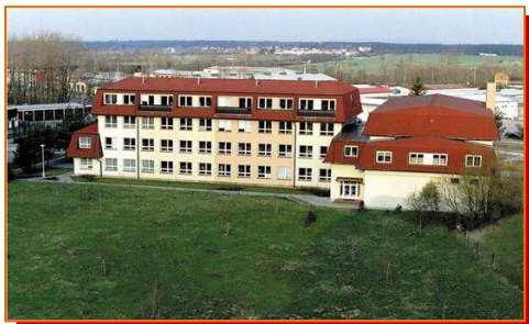
Škola, Táborská 1064

12. 10. 2017 (8:00 – 16:00 h), 09. 11. 2017 (8:00 – 16:00 h), 09. 12. 2017 (8:00 – 14:00 h), 11. 01. 2018 (8:00 – 16:00 h), + každý pracovní den dle domluvy