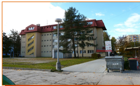
Domov mládeže, Táborská 942