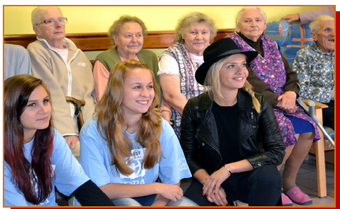
Charitativní činnost ve spolupráci s ADRA - Tat'ána Kuchařová v Domově seniorů

Vzdělávací program umožňuje získání všeobecných a odborných vědomostí a praktických dovedností potřebných k profesionálnímu vykonávání povolání ošetřovatel. Absolvent se uplatní ve zdravotnických a sociálních zařízeních, v nemocnicích nebo ošetřovatelských centrech, v domácí ošetřovatelské péči, v léčebnách dlouhodobě nemocných, v ústavech sociální péče, ve stacionářích pro osoby se zdravotním postižením, v zařízeních pro seniory a hospicích.