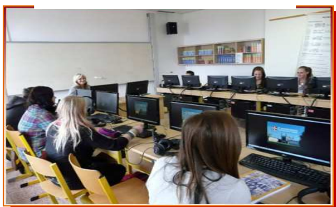
Multimediální učebna jazyků