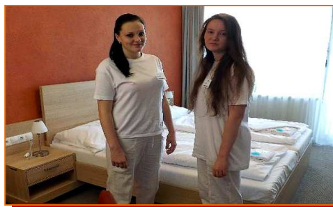
Odborná praxe v Lázních Aurora